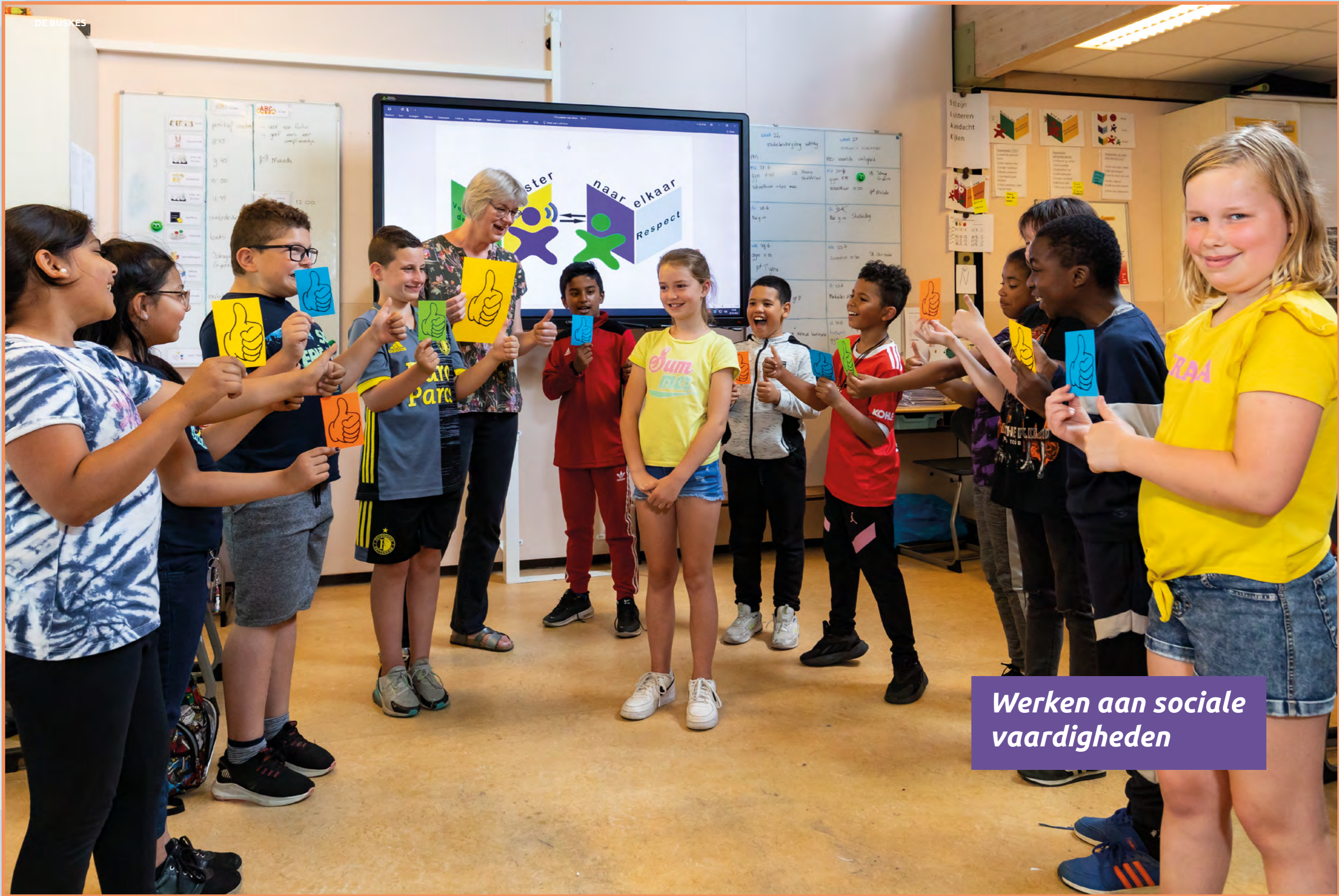
Werken aan sociale vaardigheden