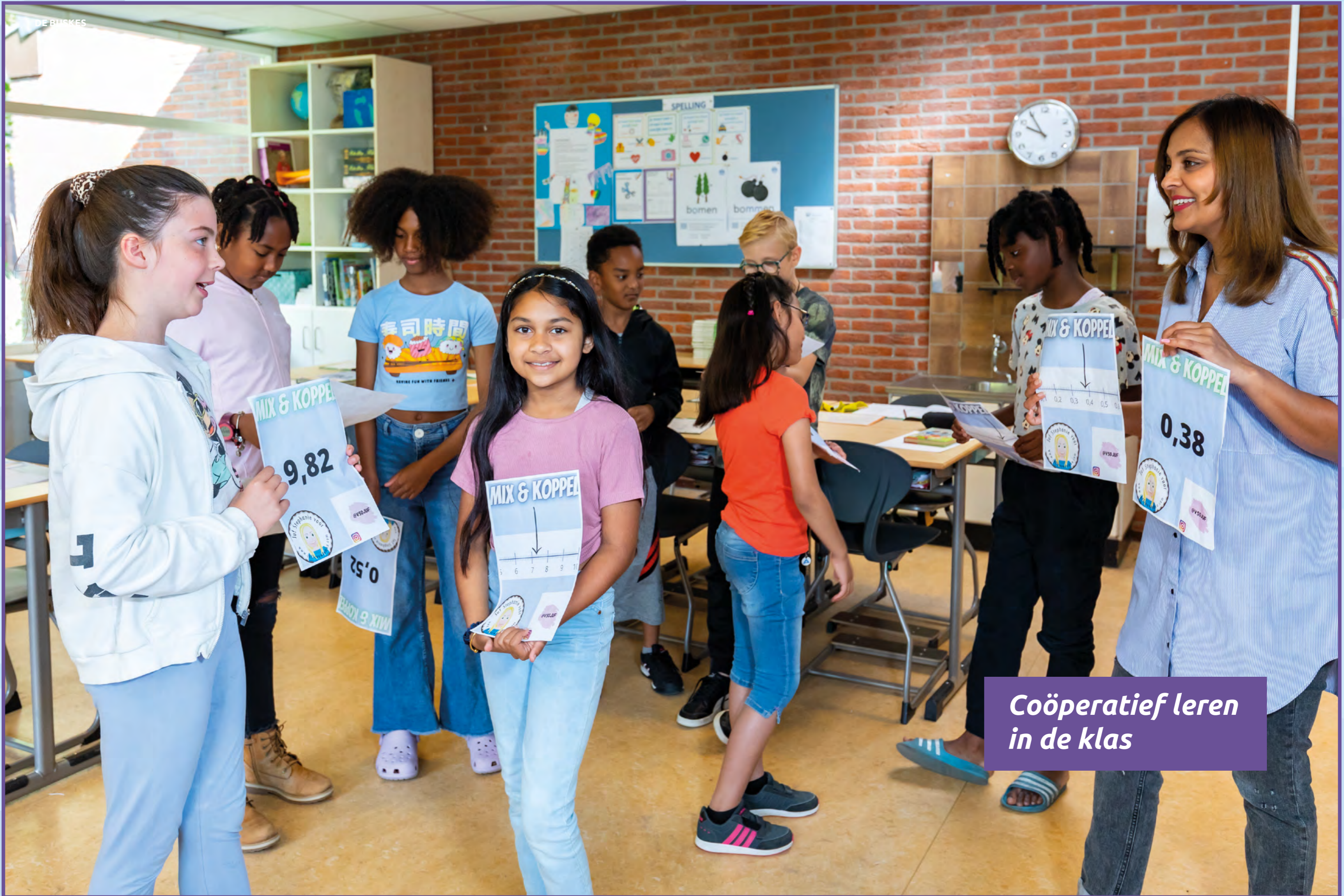
Coöperatief leren in de klas